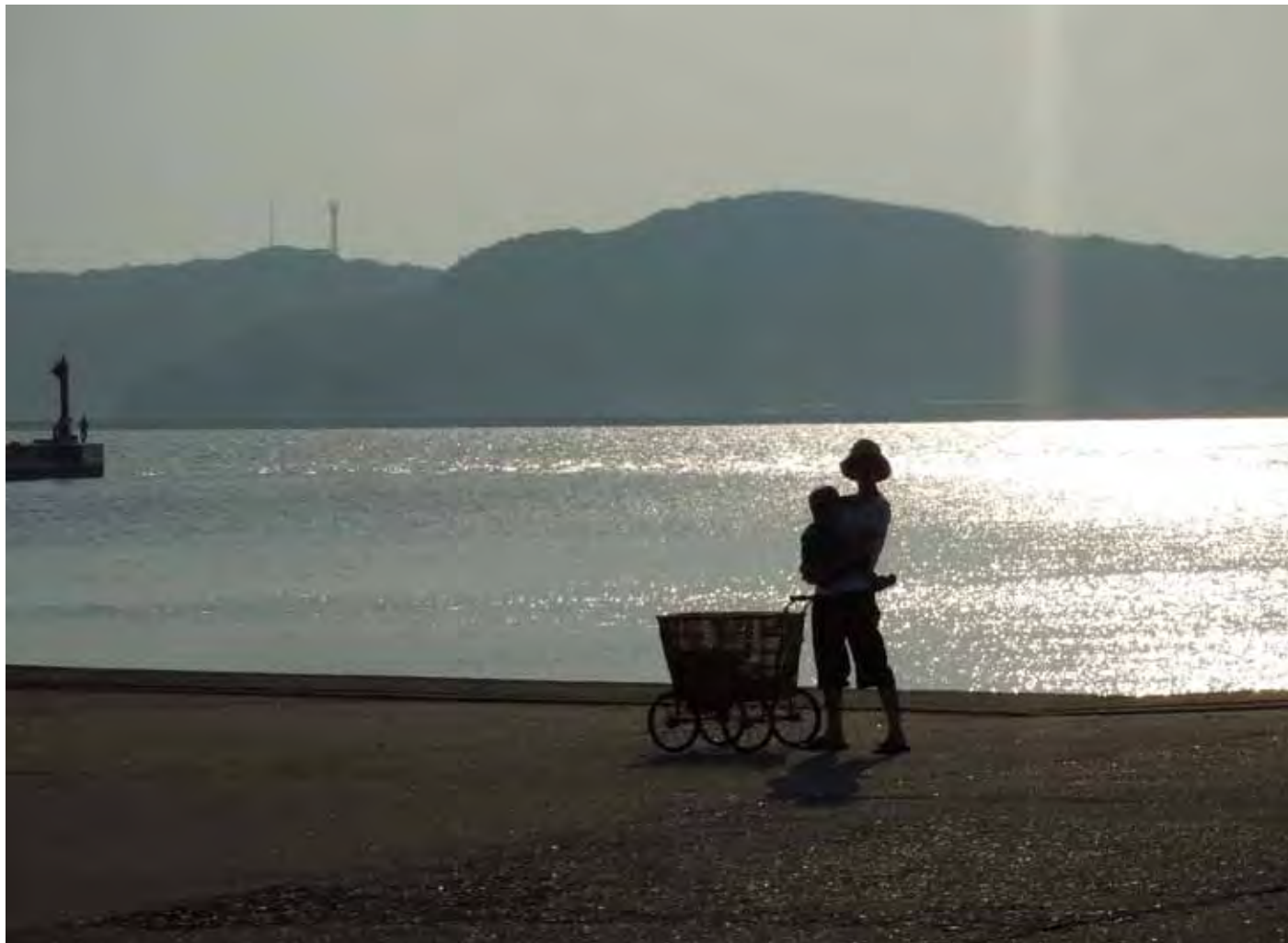
乳母車と母親 Carriage and mother