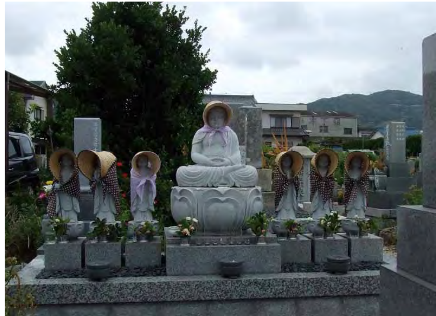
9 海を見つめるお地藏様 Jizo statues looking at the bay