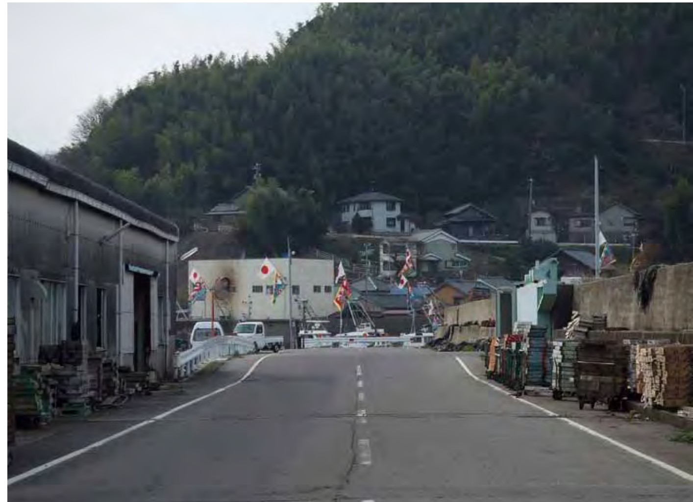
正月 New Year's Day