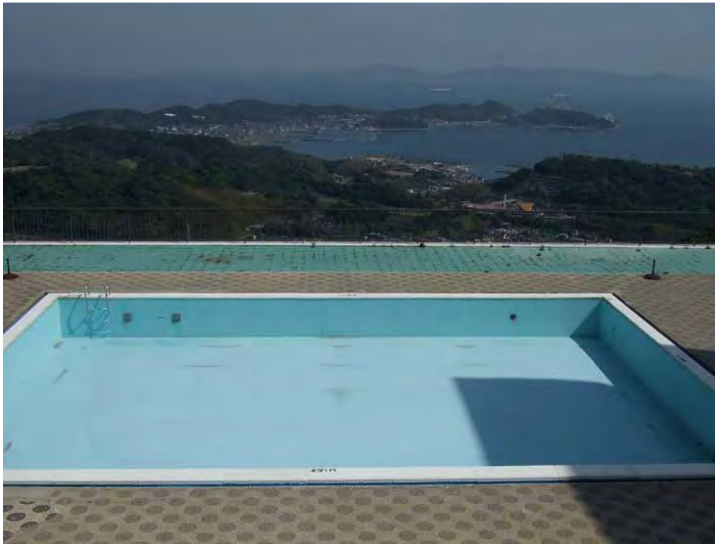
スカイプールと三河湾 Sky swimming pool and Mikawa Bay