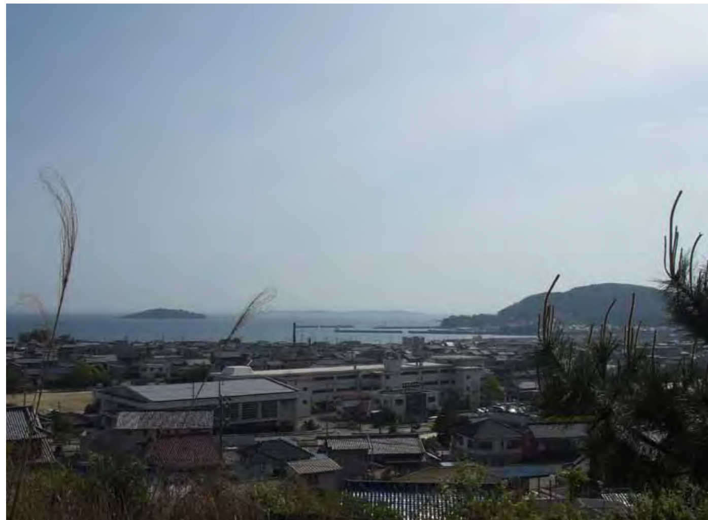
弘法山からの眺め View from Koboyama