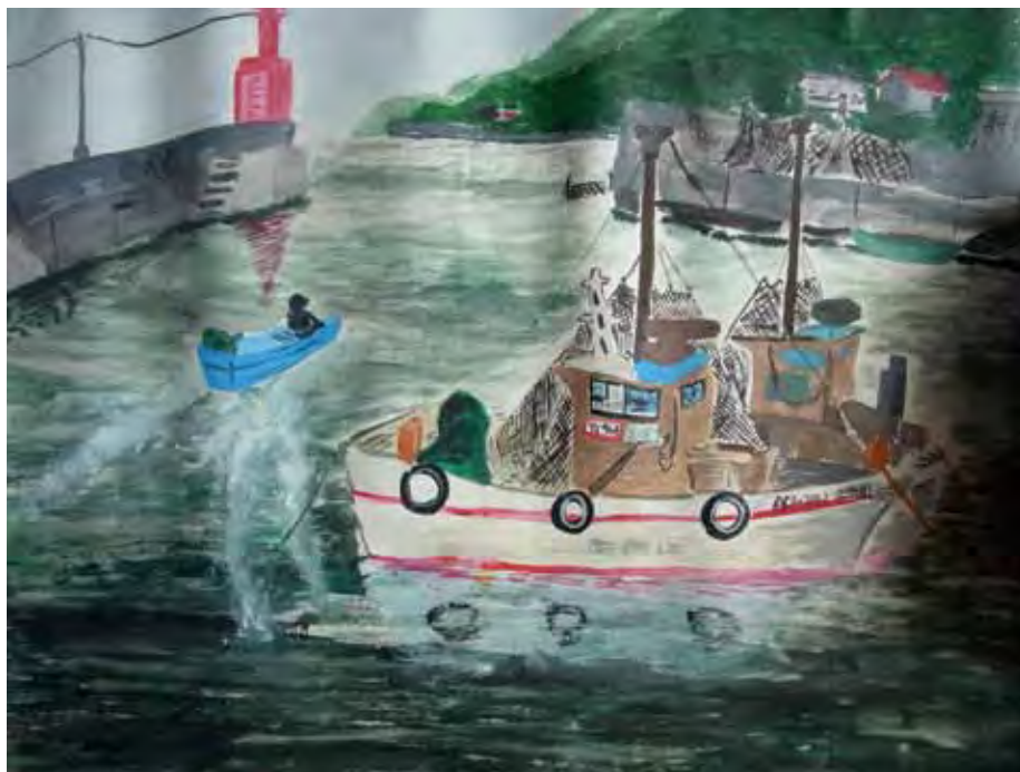
西幡豆漁港 Fishery port in Nishihazu