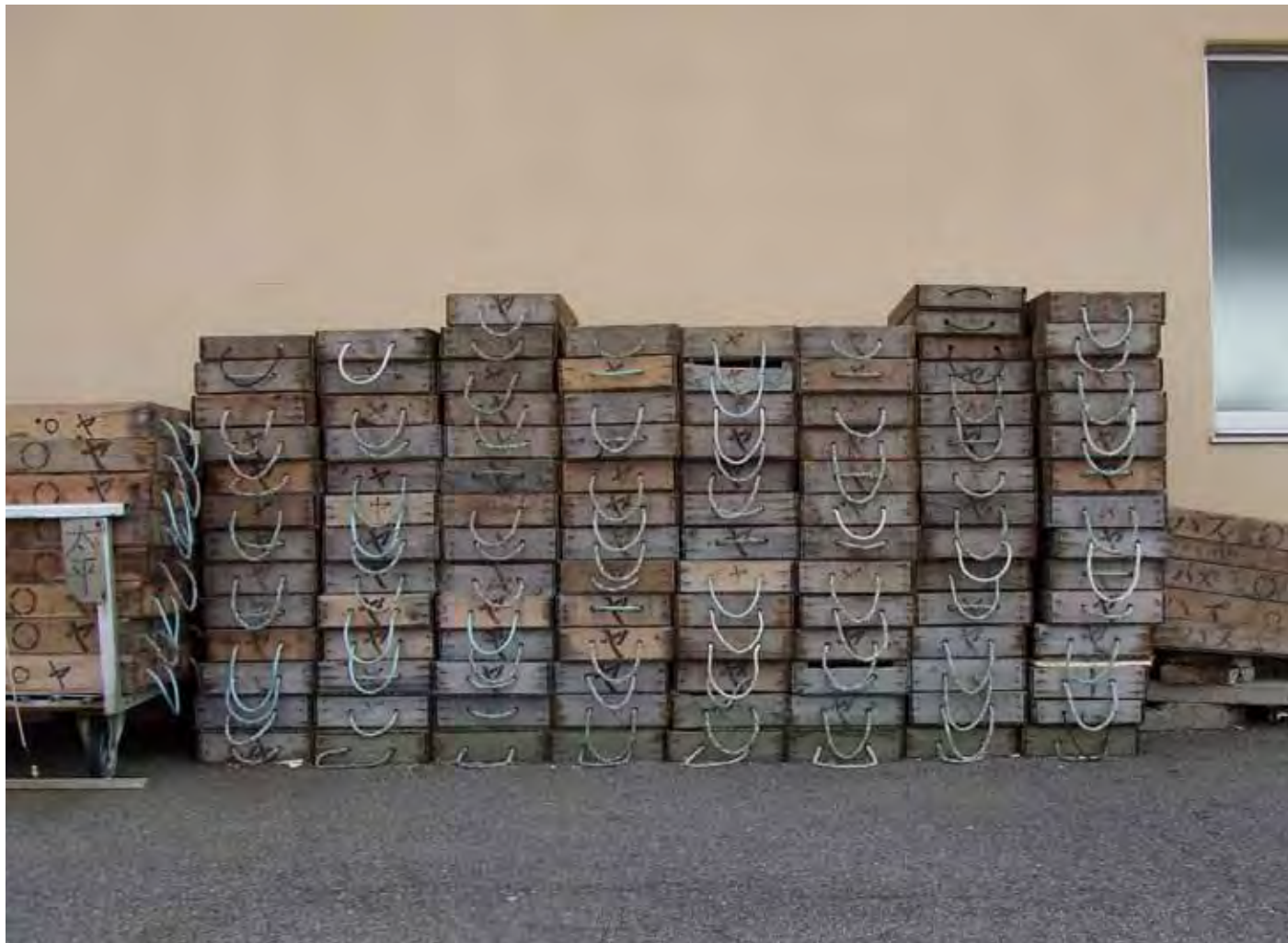
漁港のトロ箱 Fish boxes at fishery port