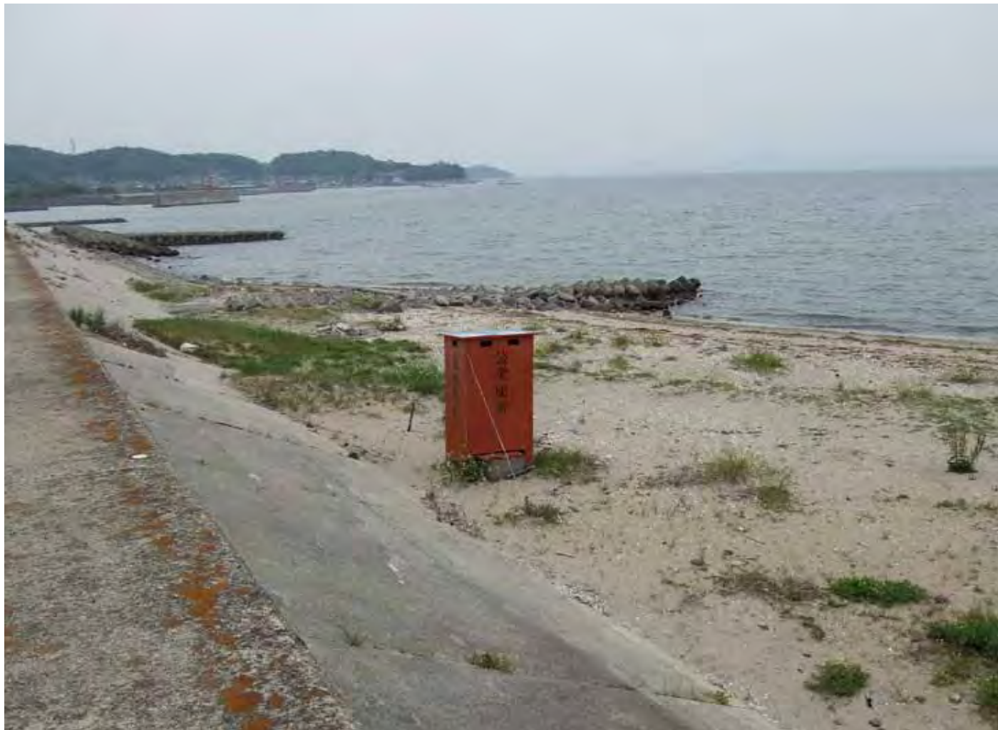
8 公衆便所 Public restroom