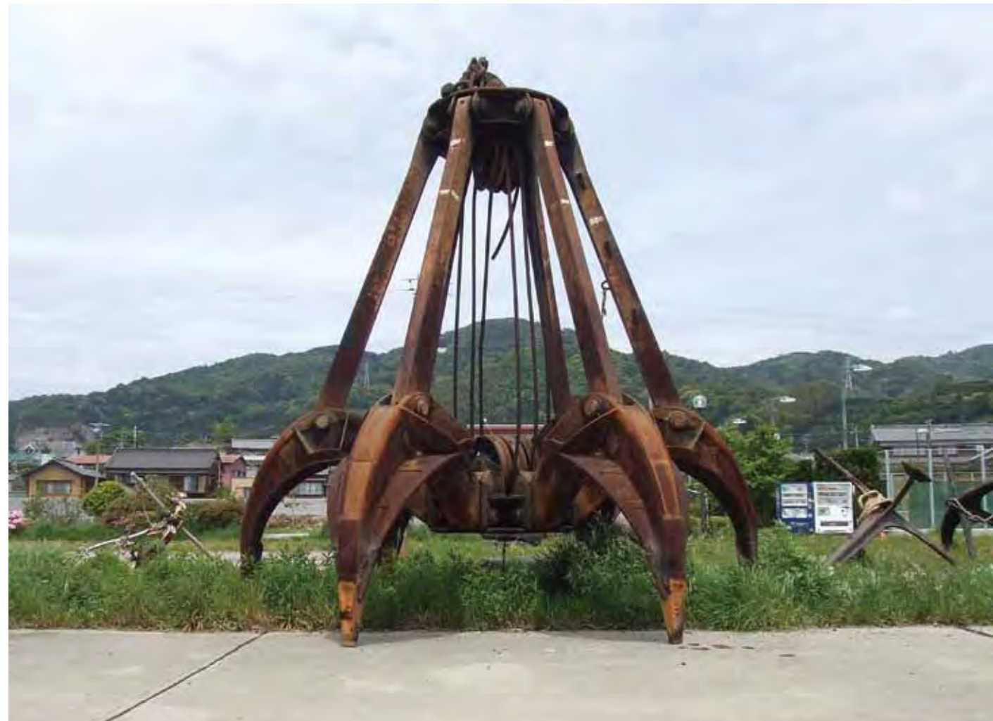
漁港の主 Master of the harbor