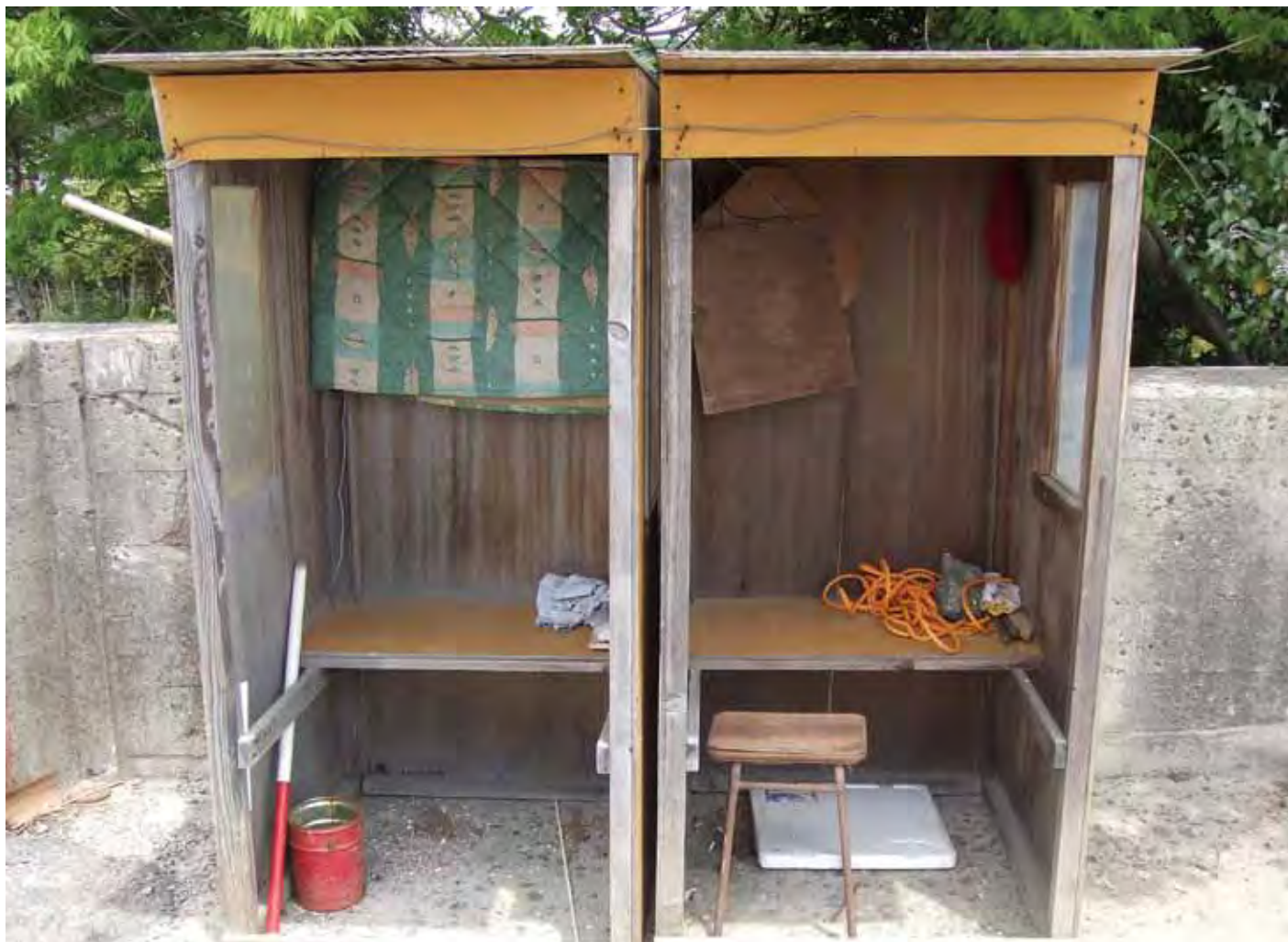
潮干狩りの番人小屋 Clamming guardian booth