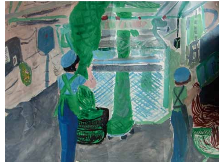
製網工場 Net making factory